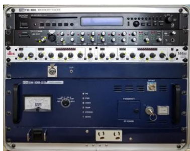
カバーオープン時