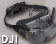
DJI Goggles N3